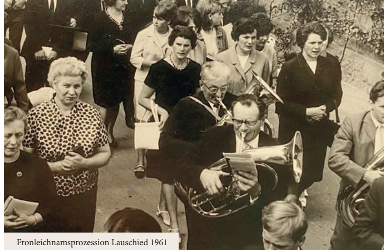
Fronleichnamsprozession Lauschied 1961