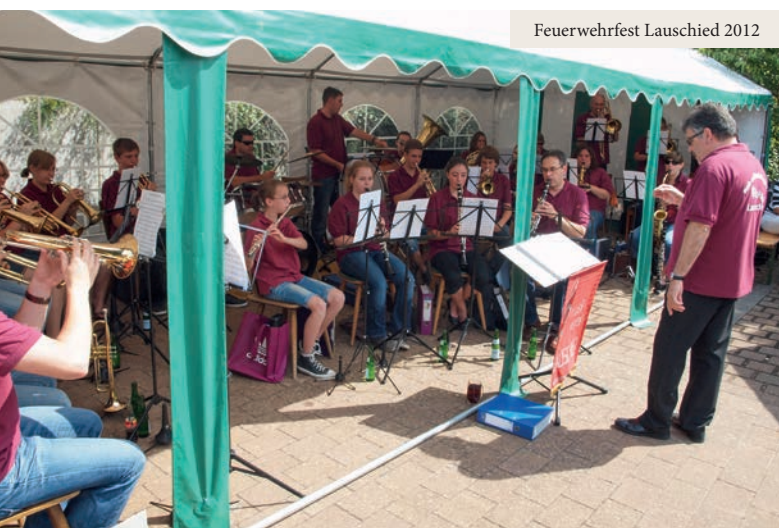
Feuerwehrfest Lauschied 2012