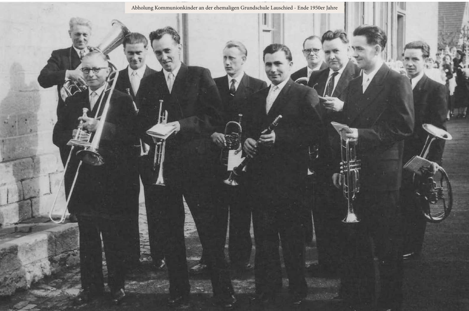
Abholung Kommunionkinder an der ehemaligen Grundschule Lauschied - Ende 1950er Jahre