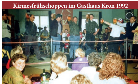
Kirmesfrühschoppen im Gasthaus Kron 1992

1. Kirmesfrühschoppen im Gemeindezentrum (davor immer im Saal des Gasthauses Kron). Bis vor einigen Jahren immer mit Beerdigung der „Kerweflasch“ am Kirmesdienstag.