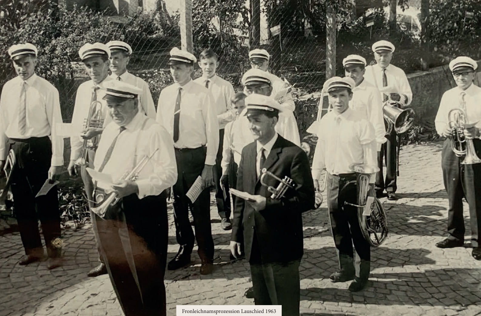
Fronleichnamsprozession Lauschied 1963