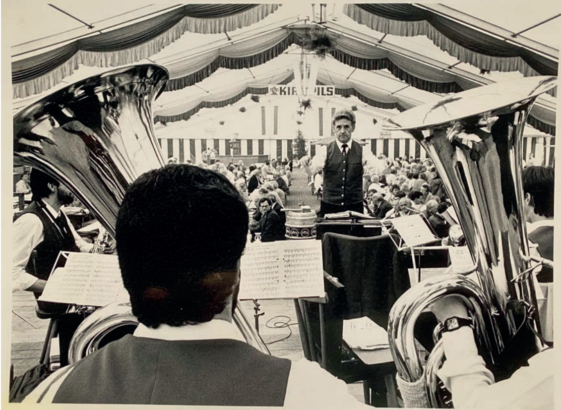
Frühschoppen Sobernheimer Johanniskirmes 1987