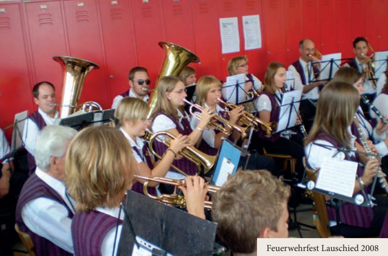
Feuerwehrfest Lauschied 2008