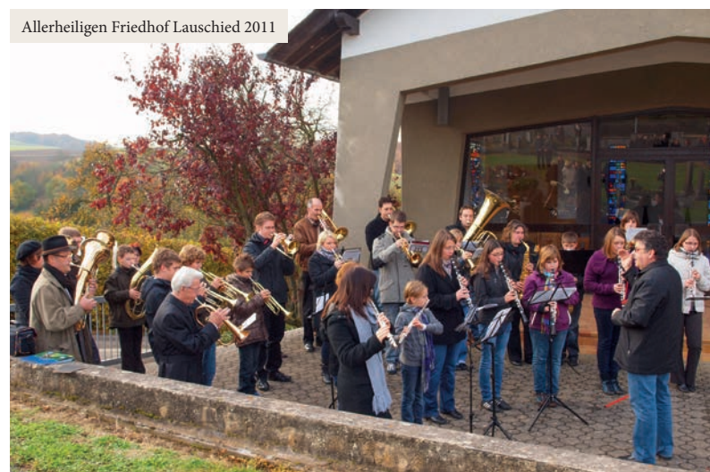
Allerheiligen Friedhof Lauschied 2011